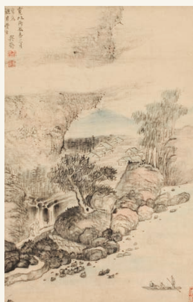
山水図(木村兼葎堂)