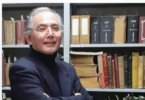
センター長 関西大学 外国語学部 教授